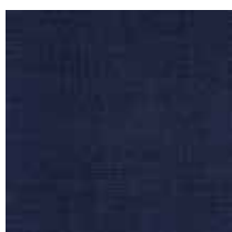
2 heavy blue